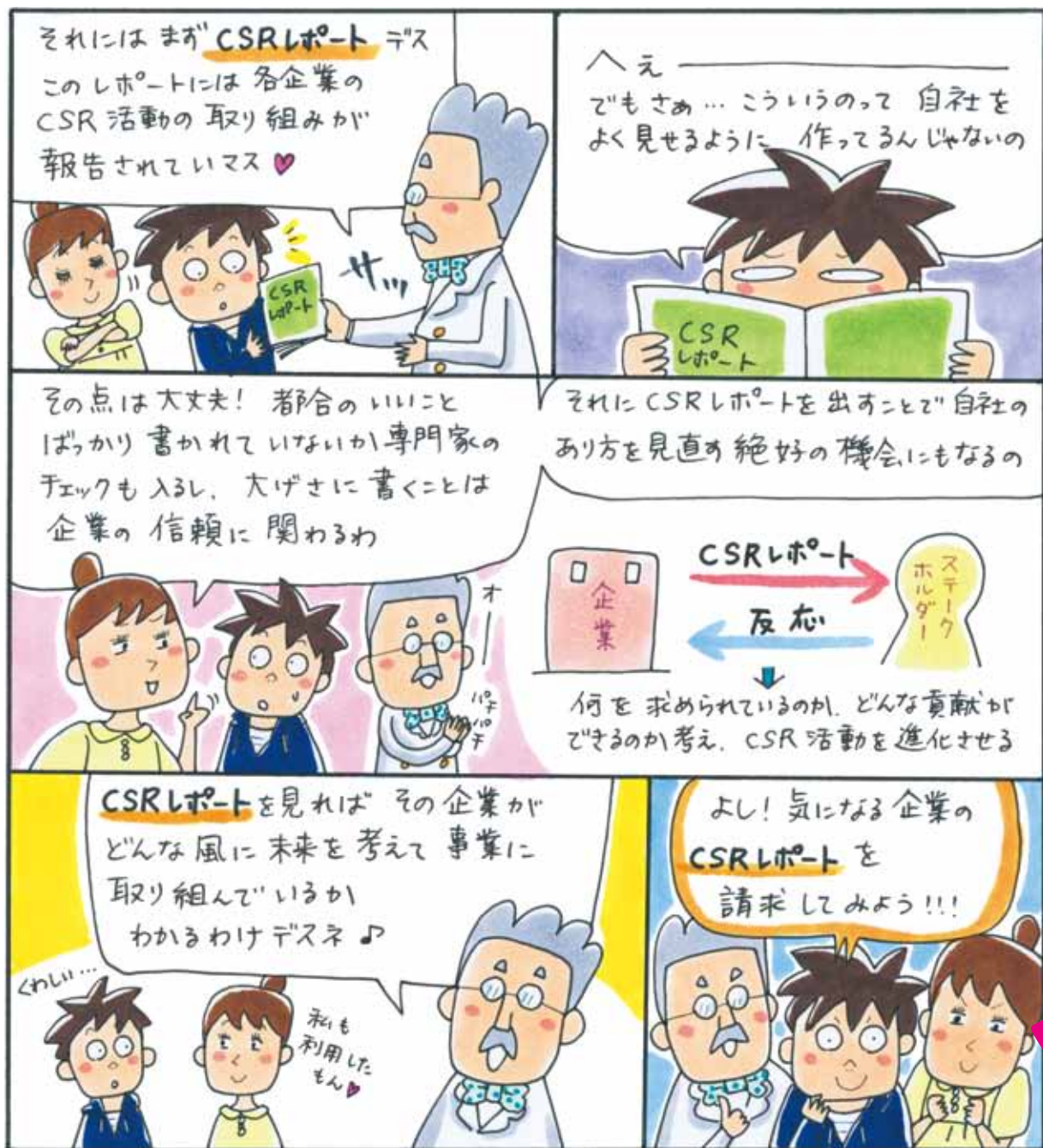
「実践編」はCARECO特設サイトに掲載中。詳しくは裏表紙をチェック!