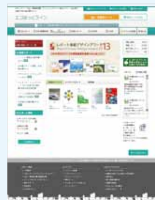
「エコほっとライン」トップページ

CSRレポートは「エコほっとライン」でいつでも無料で請求いただけます。 http://www.ecohotline.com